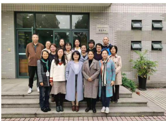
图 1: 信息中心员工剪影

迄今，中心提供了 25 份《新型冠状病毒（2019-nCoV）科研信息简报》（以下简称信息简报），达 200 多条资讯。