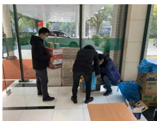
组图：工作人员每周五发放防护物资