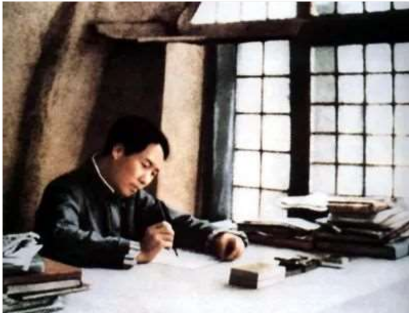
1938年春，毛泽东在延安窑洞写作。

假设毛主席生前看到杨开慧这些对他充满思念的家书和诗，又会回复怎样缱绻的信件和诗篇呢？