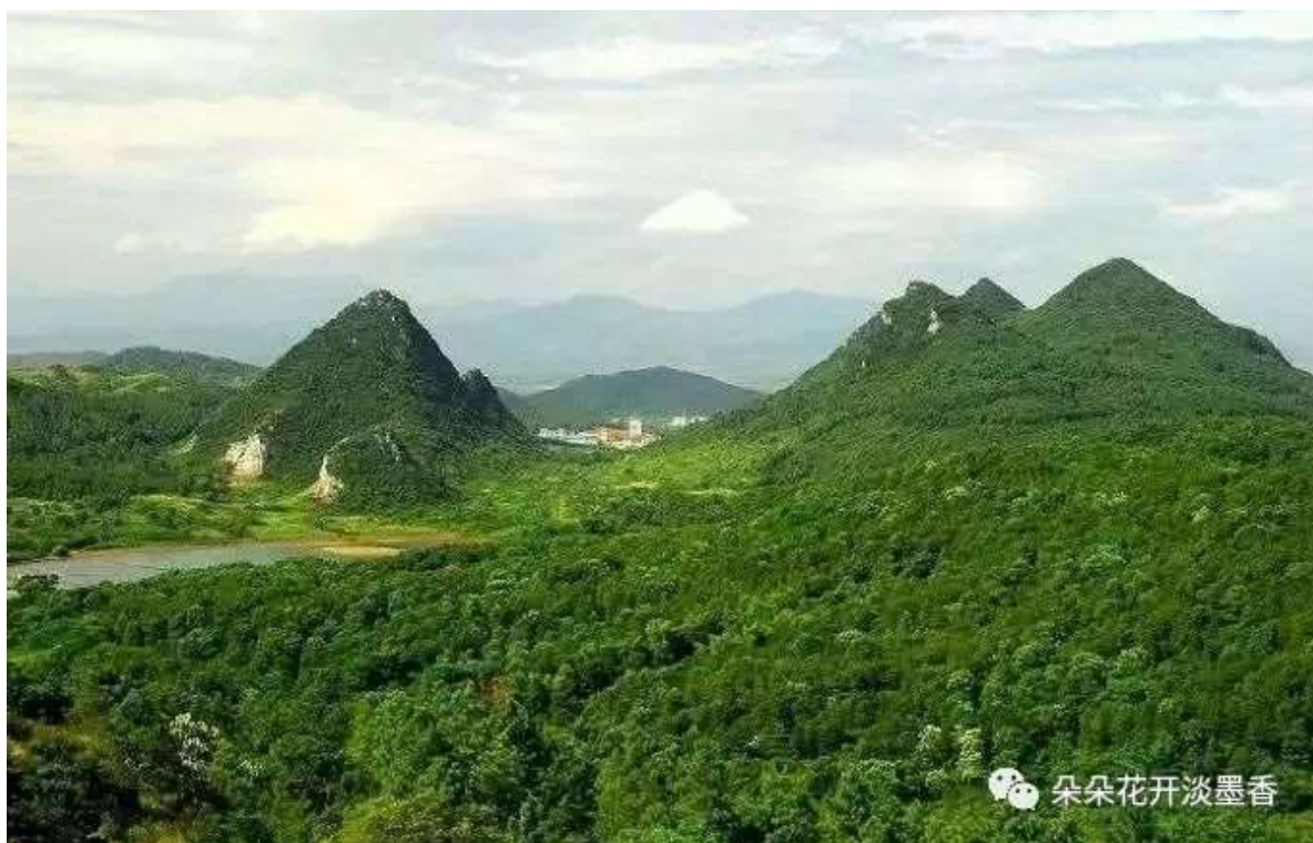
图2. 宜兴芙蓉山景

“罨画”作为色彩鲜明的绘画之意，也经常入诗词，用以形容山水景物或亭台楼榭的艳丽多姿。如唐秦韬玉《送友人罢举授南陵令》诗：“花明驿路燕脂暖，山入江亭罨画开。”晚唐韦庄《归国谣》词：“罨画桥边春水，几年花下醉。”清纳兰性德《浣溪沙》词：“一水浓阴如罨画，数峰无恙又晴辉。”与贺铸《阳羨歌》密切相关的是宋叶适《送惠县丞归阳义》诗，其中有“三岭描成翠骨堆，一川罨画绣徘徊”诗句，有人考证阳义应为阳羨，叶适比贺铸小近百岁，叶适写此诗可能受到贺铸词的启发。如果这样的话，这首诗是告慰老朋友，可以回去欣赏阳羨山水，过悠闲的生活了，因为该诗的后两句是“三年尘土无人识，山水虚闲与唤回。”这仅仅是我个人的推测，不足为真。扯远了，还是回到贺铸的词吧。