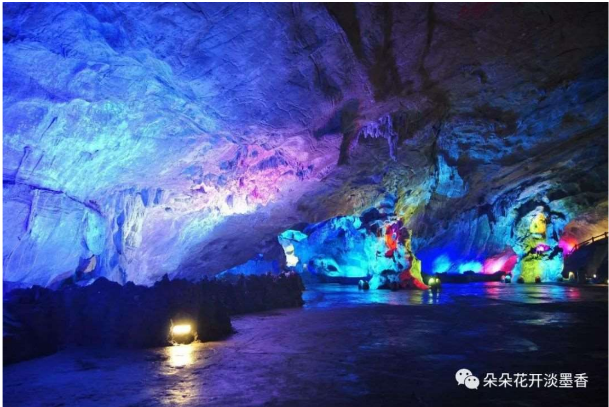
图4. 张公洞内景局部

1970年，北京电影制片厂拍摄革命现代京剧电影《智取威虎山》，座山雕的威虎厅取景于张公洞的海王厅（下图）。